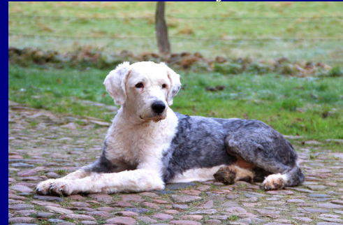
Samy im neuen Zuhause