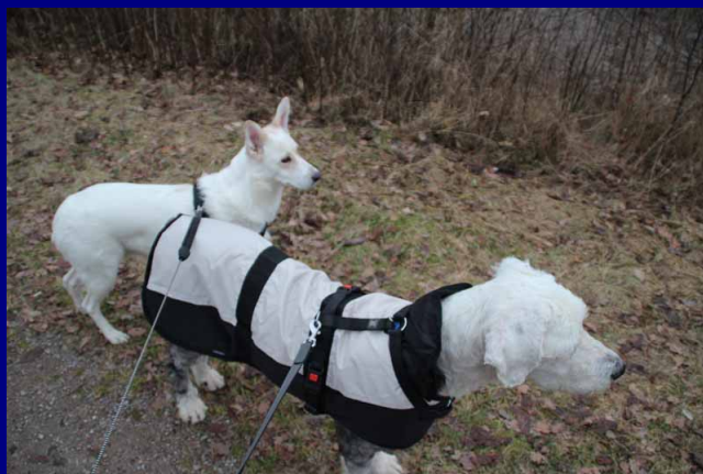
zwei on Tour.....