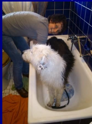
ein Bad darf natürlich auch nicht fehlen