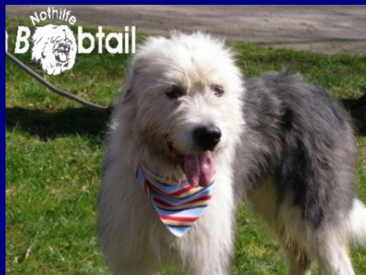
Gino bei Ulrike in Uslar

Er wurde dann für seine Reise nach Deutschland vorbereitet und konnte 3 Wochen später schon auf seine Pflegestelle nach Uslar reisen.