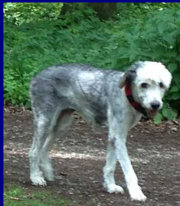
Auszug email Adoptanten