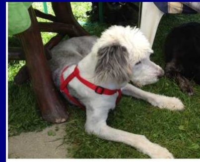
Bora entspannt beim Picknick