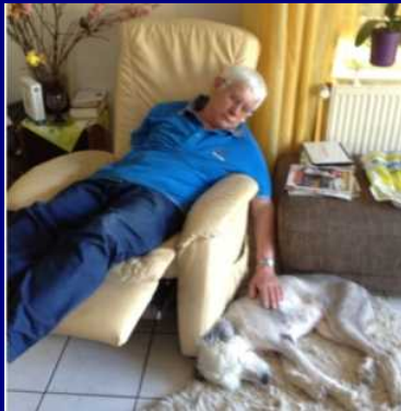
zwei müde Krieger, nach der Gassirunde