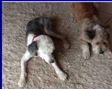
auf die Plätze, fertig los