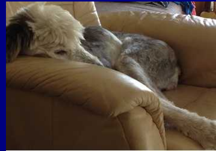
hier lässt es sich aushalten

Bora kannte nicht viel und musste noch sehr viel lernen. Es wartete eine grosse Herausforderung auf Hanne.